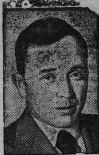
Советской Союзлэн героез А. Б. Бряндинский.