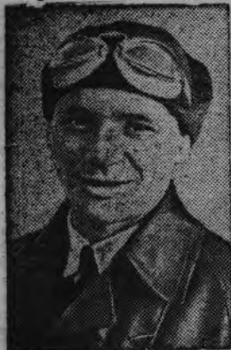
Советской Союзлэн героез В. К. Коккинаки.

Юэз кабанэ люканэн но кутсаськонэн та'че безответственно ужамзы ноқытчы чидантэм. Соин сэрэн ведь государстволы нянь сдать карон жега. Чик жегатскытэк скирдованиез но кутсаськонэз большевистски развернуть кароно.