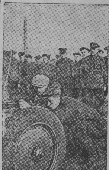
Ленинградлōн героическōй защитникъяс.

культурнōй улжйылысь да медбѓръя — оргвопросъяс. Став вопросъяс кузя коллана решениеяс примитōмōн пленум помалис асьыс удж.