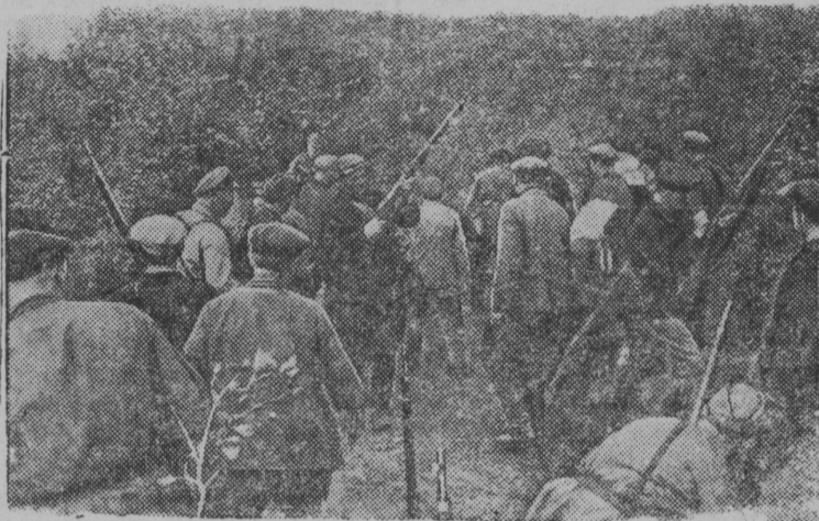
Вылён котыртöм партизанской отряд получайтö оружие.