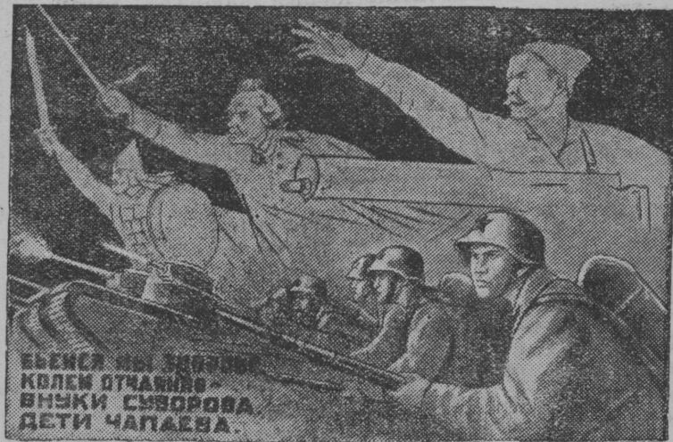
Художник Кукрыниксылөн рисунок. Текст С. Маршаклөн.