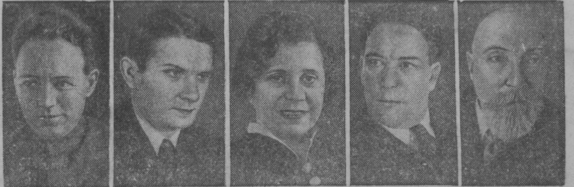
Шуйгавысыны вескыдылө писатель Михаил Александрович ШОЛОХОВ, СССР Наукас Академияса действительной член, Юрий Денисович ЛЫСЕНКО, Ленин нима Сельскохозяйственной Наукас Всесоюзной Академияса президент, Валерия Владимировна БАРСОВА, СССР-са народной артистка, Ленин ордена СССР-са Государственной Академической Большой театрас артистка, Петр Леонидович КАПИЦА, СССР Наукас Академияса действительной член, Владимир Петрович ФИЛАТОВ, УССР Наукас Академияса действительной член, экспериментальной офтальмологияс Украинской институтын директор.

Наукаса, литератураса да искусствоса выдающийся деятельяс, кодъяс полчитисны первой степени сталинской премияяс.