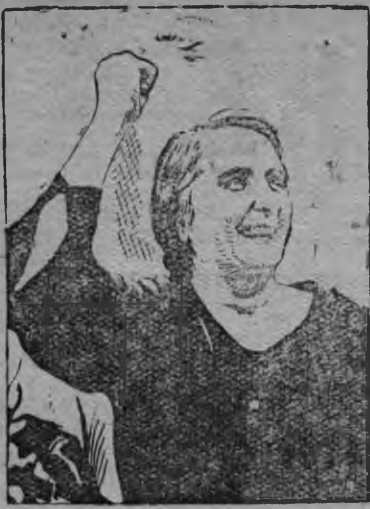
Долорес Ибаррури (Пасионария).