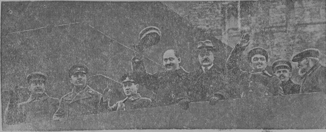
МОСКВАЫН, 1938 ВОГА НОЈАБР 7-дџ ЛУНО.

Партијаса да правителствоса руковоџтелјас (шугавывсањ вескыд вылџ) И. В. Сталин, К. Је. Ворошилов, Н. И. Жево, Л. М. Каганович, В. М. Молотов, А. И. Микојан, А. А. Андреев да М. И. Калинин јортјас чолџмалџны демонстрантјасџ.