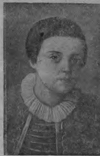
М. Ю. Лермонтов пинал ар'ёсаз XIX столетилэн кызет ар'ёсаз известной художниклэн улам портретэз

Короленко нимо городской библиотека юбилейной нунальёс азлы люка поэтлэн улэмез но деятельность сярэсь материалёсты (книгасты, Лермонтов сярэсь газетной но журнальной статьясты, аслэстыз поэтлэсь произведениосё но мукетьёсёс). Лыдзискон залын организовать каремын выставка, кудйз сиземин Лермонтовез тодэ ваёназы, абонементын ошко литератураослэ рекомен-дательной списокьёс.