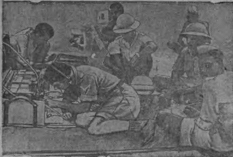
Абиссинской партизан'ёслэн полевой радиостанцизы.