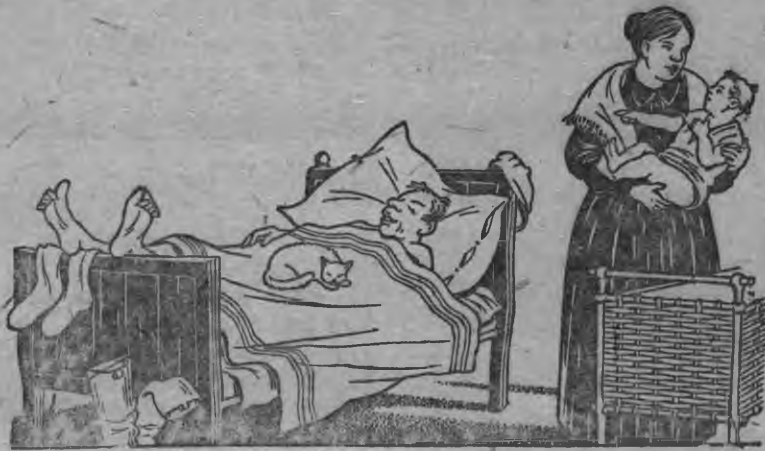
Мумиз (пиезлы): Изы, верато тынды. Тини аид сайкалтытэк кык-тэти нуналэ изе ни, нош тон умме но узьыны уд быгатйськы. Пиез: Нош луэ-а зеч пзыны, мумы, сиче ан бере?!