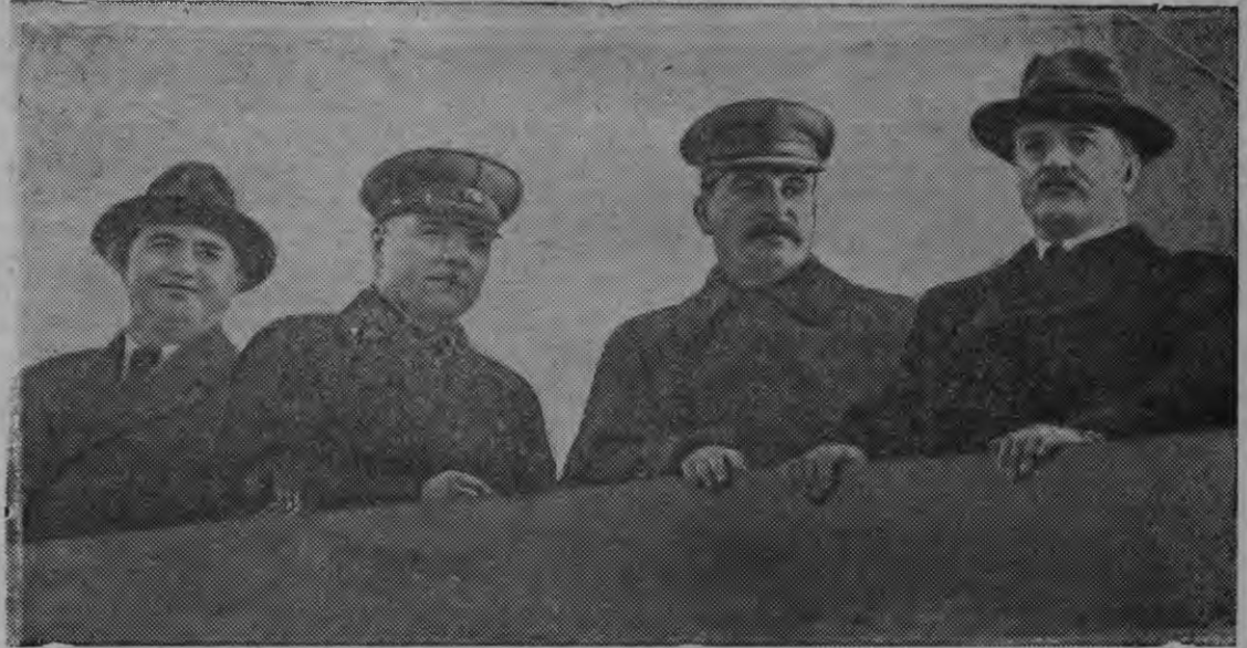
Бурисен паллянэ: В. М. Молотов, И. В. Сталин, К. Е. Ворошилов но Г. М. Димитров мавзолейлэн трибуна вылаз.

В. М. Молотов эшез СССР-лэн Народной Комиссар'ёсызлэн Советсылэн Председателезлэн обязанностьёсысьтыз мозмытон сярысь СССР-лэн Верховной Советэзлэн Президиумезлэн УКАЗЭЗ