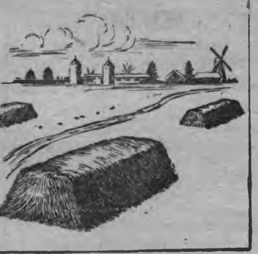
Кьедэз тазы шонер тырыны кулэ (штабельёсы)

Ортчем аръёсы практика возьматиз, что со колхозтёсын, кудтёсыз данаксэ кьедэз толалтэ поттыны бз быгатэлэ, отын трос кьед озы ик лудэ поттытэк кылылыз. Сибириы, союзысь юго-восточной, южной но