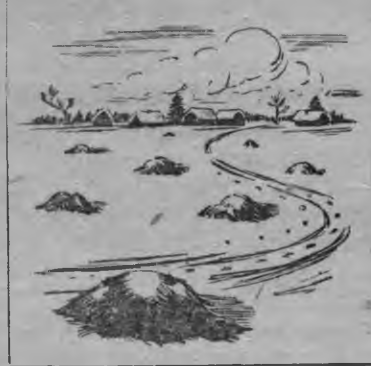
Лудэ кьедэз тазы бөвл кыськано

быры но кьед уг кымы, а сонн ик кьед жог но зеч кьедэз возён дыртя но таке ик порядок но утялтон пуктоно.