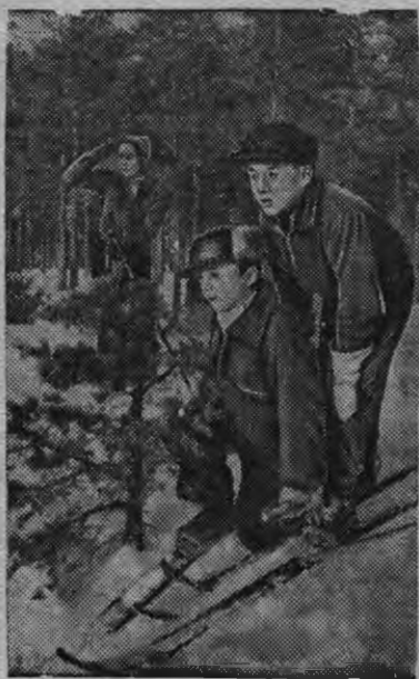
Таллинлэн окрестнояз — Неммын эстёвской школьникгёслэн нырысетй военизированной шудоны орчтытмын вал. Снимокы: "Дозоры".