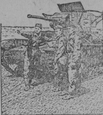
На рис: Отличники боевой и политической подготовки комсомольского танка Я. С. Бурлуцкий во время тактических учений дает задание своему экипажу.

Комсомольцы танкисты Н-ской части Киевского военного округа взяли на себя обязательство встретить 20-ю годовщину комсомола отличными показателями по боевой и политической подготовке.