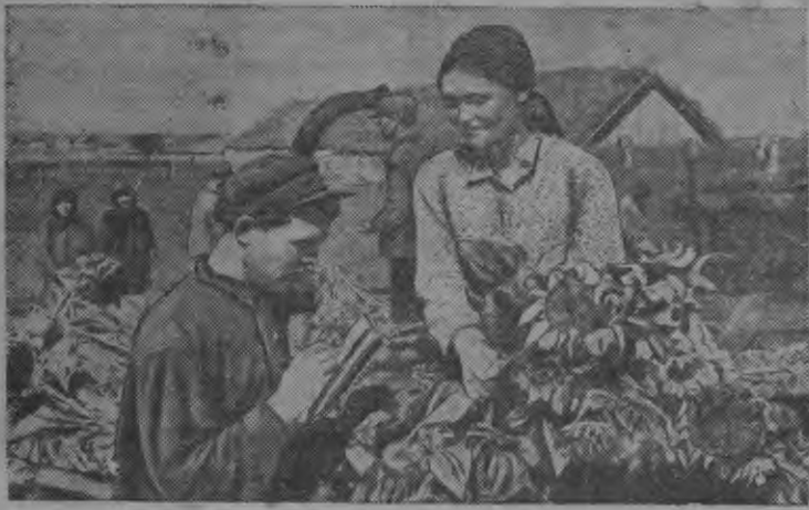
Воронежской области Каширской районсь „13 лет Октября“ колхозэн молочно-товарной фермаз толалэ азелы пудо сион дасян зол мынэ. Синос тырны 8 гу дасямн ни.