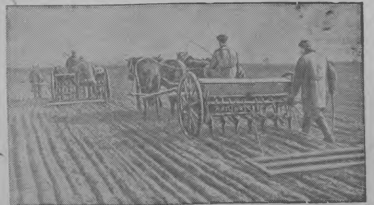
Сталинской областельсь „Пролетарская нива“ колхозын сезы кизё.

Гыремын 2425 га, со пблысь трактор'ёсын гыремын: Буриной МТС-ын—125 га, Балезинской МТС-ын—120 га. Киземын 1035 га.