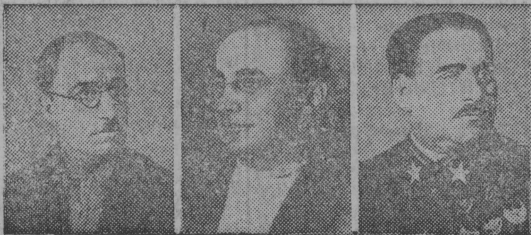
М. А. Багіров. Л. П. Беріја. В. К. Блүхер.