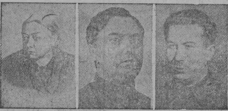
Н. К. Крупскаја. Г. М. Малөнков. П. Г. Москатов.