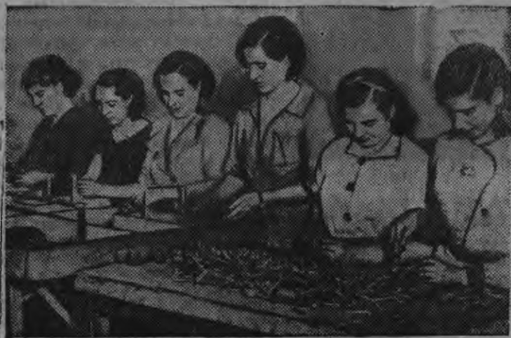
Снимокы: Мадридэс патронной заводлэн одйг цехаз вылькышвоос ужанназы.

Бадзым энтузиазмен ужало республиканской Испаниян вылькышвоос странаалэн оборонной промышленностяз.