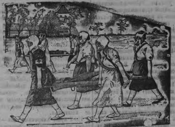
Снимокы: РОКК кружоклэн химической нападенилэс «пестрадакшойлэн» юрттат сётонья ужез.

Осоавиахимлэн Горький городыс Свердловской райсоветэз противовоздушной оборонае август толэзе занятие ортытэ.