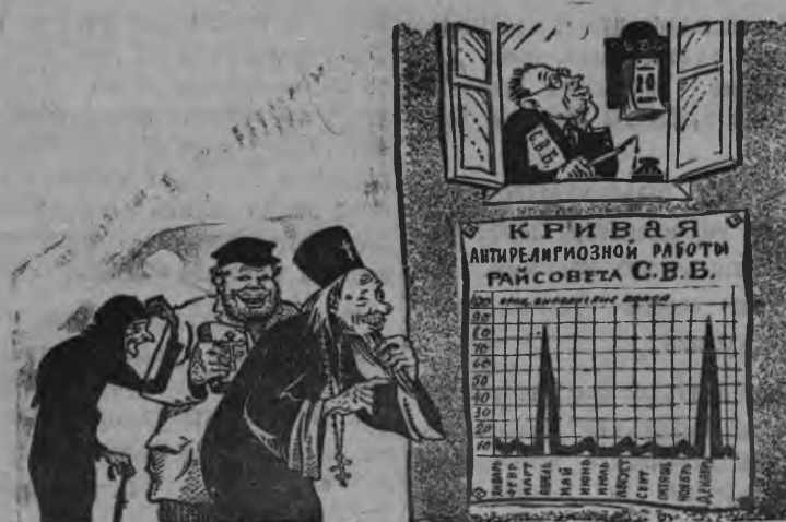
Церковник'ёс: «Вот та „кривая“ ик милемды вывозить каре»