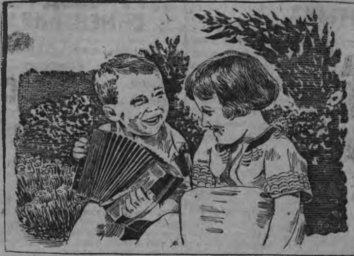
Ленинград городысь Дзержинской районысь пионергородокын. Сөкжалэн фото-этиюдисытыз рисунок (Союзфото) «Прессклише».

Президентэ гинэ быр'ён сярсы кандидатураос пумысен реакционной круг'ёс та берло нунал'ёсын сыче кыл вйдо, что выль президент крупной промышленник луыны куле.