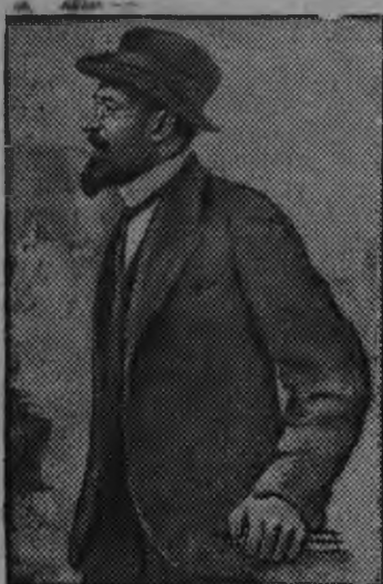
Снимокы: Ладю Кецховели.

Туэ 17 августэ Закавказьеын большевистской партилен крупнейшой организаторезлэн Ладю Кецховелилэн кулэмез дырысен 35 ар тырмиз. Ладю Кецховелиез виизы Метехской тюрьмаын царской палачёс.