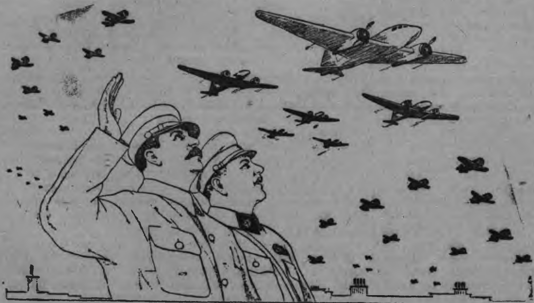
Н. Денисов но Н. Ватолина художник'ёслэн плакатысьтызы Н. Денисов художниклэн перерисовкаез