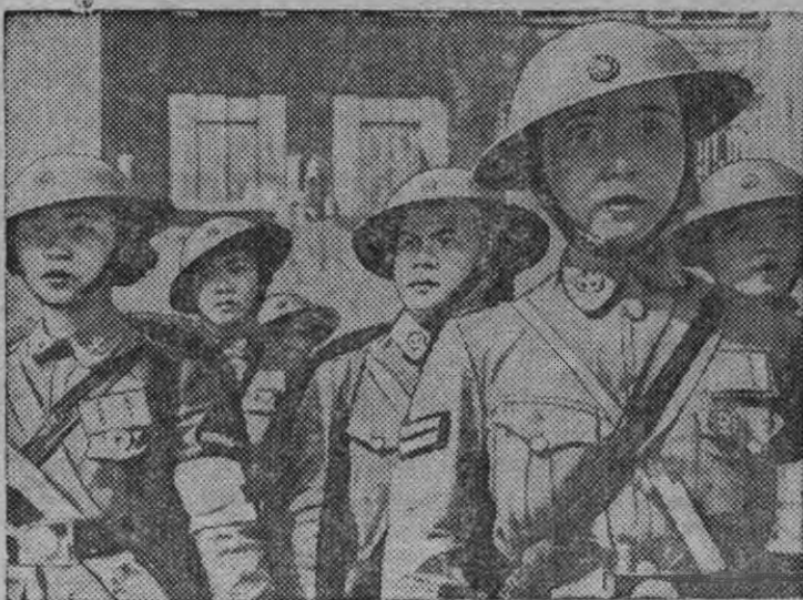
СНИМКОКЫН: Санитарной отрядэ пурем китайской нылгышноос санитарной ужлы дышетско.

Китайской нылгышноос самоотверженно нюръясько японской интервентёслы пумит, санитарной отрядёс организовать карыса бомбардировкаос дырья населенилы юртто.