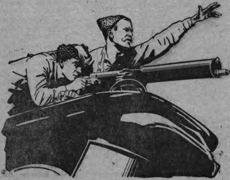
„Чапаев“ фильмысь кадр Чапаев—Бабочкин артист, Петька—Л. Кмит артист

Пересь пид'есыныз, азыпала тубыржем пид'есыз выла султыз