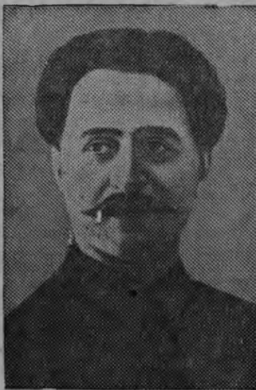
С. Орджоникидзе (1920) арын

1918 арын гужем Ленин но Сталин Сергоез Северной Кавказэ направлять каре. Отын со кыл-