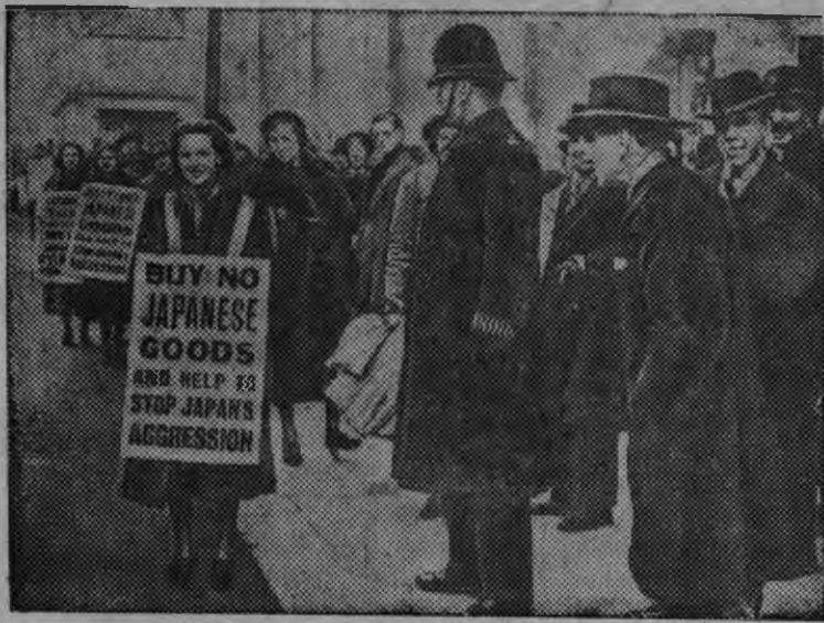
Лондонда улчаосаа антияпонокой демонстрациос. Плакатыс ылын гожтэмын: «Японской вуз'эсты эн бастыла, японской агрессияеа дугдытыны юрттэл».