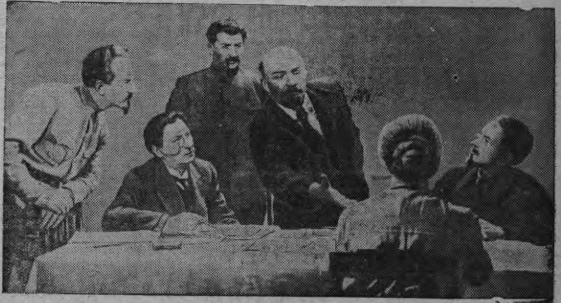
В. И. Ленинлэсь рользэ исполнять наред СССР ысь народной артист Б. Б. Щукин. «Ленин в Октябре» фильмысь надр.

Бадзым звуковой художественно-исторической революционной фильм «Ленин в Октябре» бадзым азинсконэн демонстрироваться нарисыне Советской Союзысь кино-театр'еслэн экран'ессы вылын.