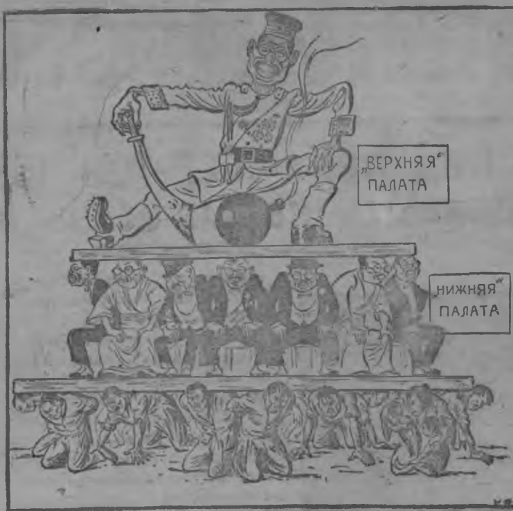
Японын двухпалатной система

Асьме кунлэн бад'ым территория вылаз котыкыче но полез-