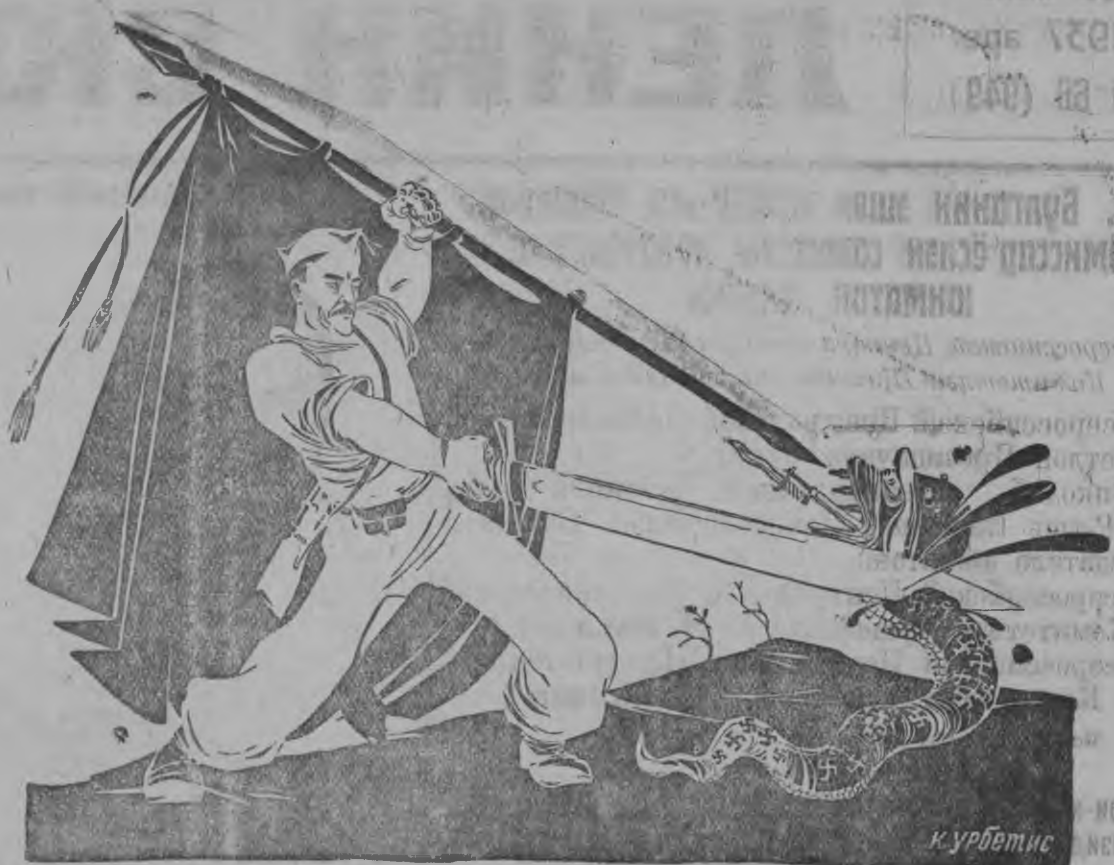
Испаниель народной массалэн нюр'яськемез асьме кунмылэн независимостез понна нюр'яськон вань соиз Чоп... Международной мирез защищать карыса нюр'яськов, вань передовой но прогросивной человечестэсь обшор ужэз защищать карыса исторической нюр'яськов. (Испаниель Компартиял ЦК-лан расширенной пленумаз Диас эшлэн докладэз'я кутэм резолюциясыз)

Озы Парви МТС-нысь котькуд комбайнер но тракторист но октон-валтон удыны газет'ёсыз басыт. Уборочной ужын беседаос орчылт'аны агитатор'ёс висч'ямын. Платунов.