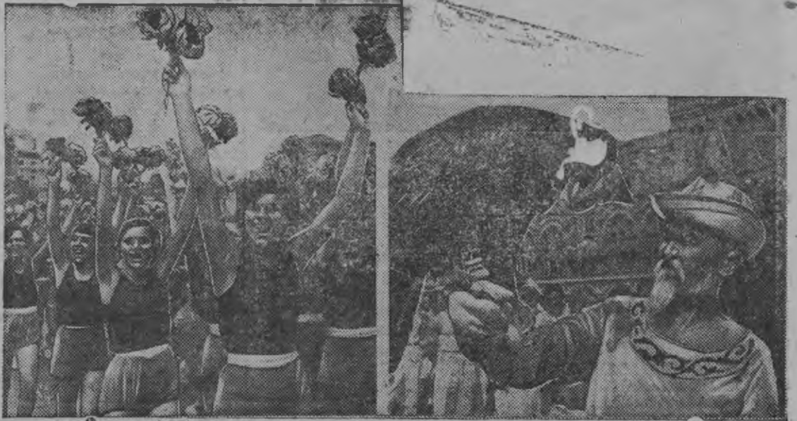
Паллянысез: Физкультурник'еслэн колонназы партия но правительстволэс кивалтисьсэс зечкыладо. Бурысез: Киргизской ССР-ысь физкультурник'еслэн колонназы беркутан охотник.

11 Союзной республикаосысь 40 сюрс физкультурник'эс аосьсэлэс кужымзэс, быгатамлык'есэс, родиналы преданностьсэс но физкультурник'болэн оамой матысь другылы Сталин эшлы пуктам преданностьсэс возмат'ызы.