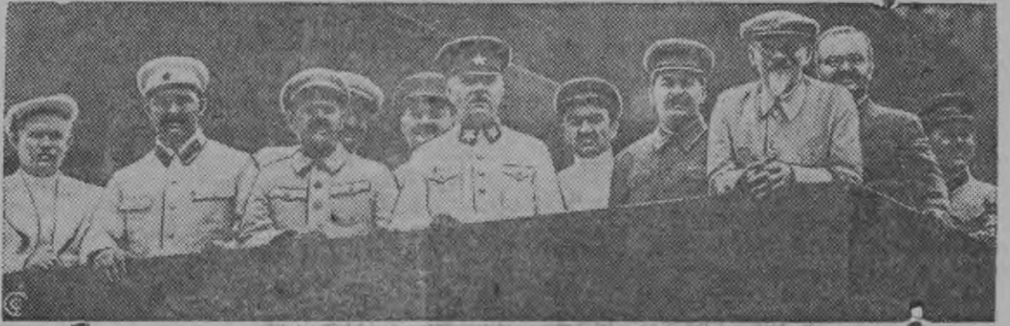
Мавзолейлэн трибунаыз партия но правительстволэн кивалт'ёсыз (бурысен палляиз): ЕЖОВ, МОЛО-ТОВ, КАЛИНИН, СТАЛИН, МИКОЯН, ВОРОШИЛОВ, ЖДАНОВ, ДМИТРОВ, АНДРЕЕВ, КАГАНОВИЧ, но ХРУЩЕВ эш'ёс.

11 Союзной республикаосысь 40 сюрс физкультурник'ёс асьсэлэсь кужымзэс, ыгатамлыкэс, родиналы преданностьэс но физкультурник'ёслэн самой матысь, Аргызылы Сталин эшлы пумтэм преданностьэс возмат'ивы.