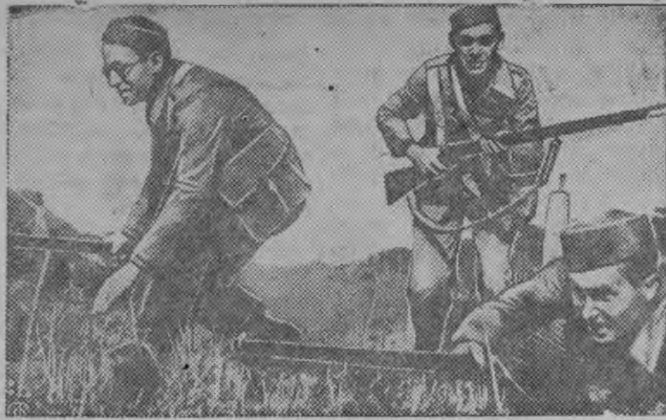
Курсант'ёс военной занятитын.

Барселона котырын военной олуэбазе призвать карем гражданысы нырысь лагер устыськыз. Татын соос сложной военной техникаез изучать каро.