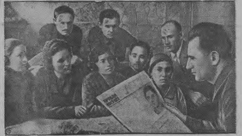
Пропагандист Назнов эш «Красная зоря» (Ташкент) вуриськон фабрикаысь парторганизацияысь коммунист'ёсын беседа ортытэ.