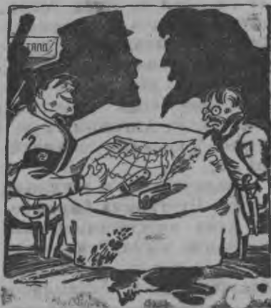
Очередной вадание басьтон бордын.

эегуд нечерноземной полосаны—Белоруссиян, Западной, Московской, Горьковской, Ярославской но мукет област'ёсын. Белоруссиян, кылсарысь, гудыр'яса зорем бере, шуньт, шундыё инквазь пуксиз. Озимойёс гумнасьмо.