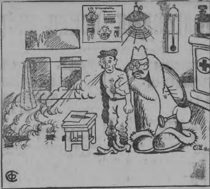
Глаз амбулаториез пу өвслэн уг эсто.

20 февралэ ужас'ёслэн производственной совещанын вал. МТМ-лэн директорез Брагин стахановской декадалэн йылпум'явы'ёсыз сарысь вакчияк доклад лэсьтис. Брагин стахановец'ёслэн опыты сарысь докладав палкыл но өз вера. А. Ф. Николаев.