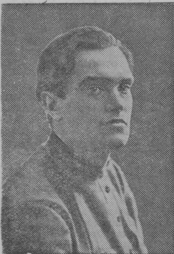
В. В. Куйбышев (1917 г.)

Затем наступил период гражданской войны. С именем Куйбышева связаны крупнейшие победы Красной Армии в борьбе с белогвардейцами. В частности с именем Куйбышева связана оборона Самары, разгром Колчака, оборона Астрахани, очищение Средней Азии от басмаческих банд.