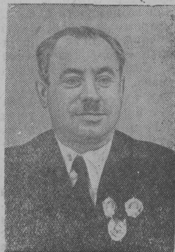
«И. Сталин» ледокол вчӧсь экспедициялӧн начальник—Советскӧй Союзлӧн Герой ӧрт И. Д. Папанин.