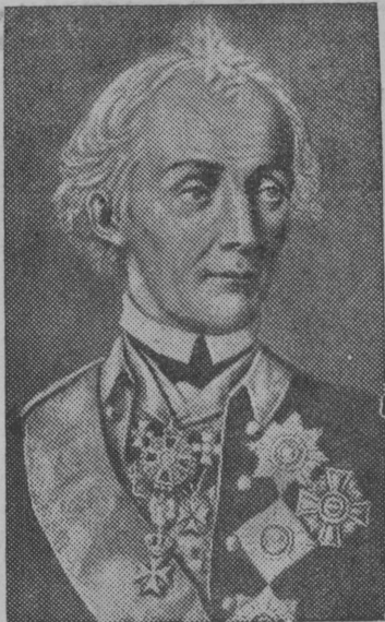
А. В. Суворов.

Русские солдаты, предводительствуемые своим выдающимся полководцем, проявляли образцы героизма на берегах Ду-