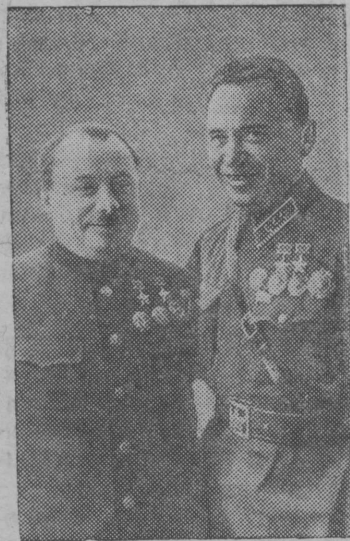
СоветскѢй СоюзлѢн кыкѢпѢ Геройез И. Д. Папанин да авиациялѢн генерал - лейтенант С. П. Денисов.