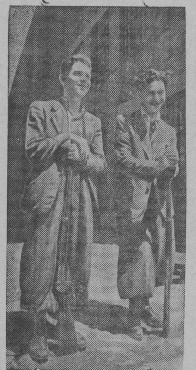
Снимок вылын: "Геркулес" трикотажнӧй фабрикась том работӧй фабрика дывся пост вылын.

Севернӧй Буковинаӧ Краснӧй Армиялӧн часттез вступитӧм бӧрын Черновицы городез предприятиязись рабочӧйез организуйтисӧс работӧй комитеттээс и пондӧс охраняйтны предприятияз.