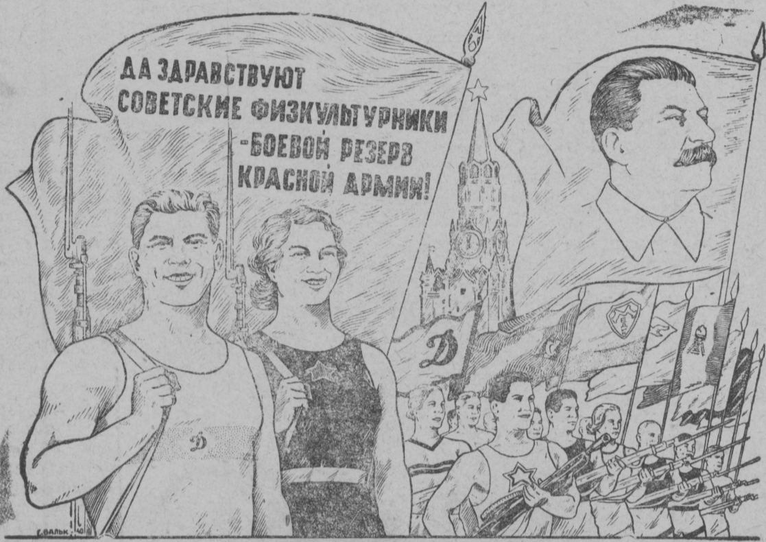
Рис. Г. Валькайн.

Советскэй физкультурной движениё успехезлөн источникён вёл, эм и одзлань лоас большевистскэй партиналөн руководство. Физкультурниккись II Всесоюзной Лун чулбткё советскэй физкультурниккес эшб крепыжыка сплотитчасё Ленинлөн—Сталинлөн партия гёбр да физкультурниккезлөн медбур друг, народдэзлөн великэй вождь ёрт Сталин гёбр.