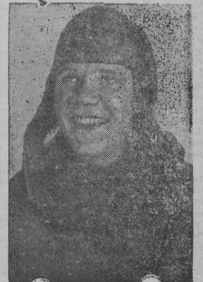
Снимок вылын Г. А. Богомолов.

Осоавнахим Центральной Советлөн Президиум присвоитись Наркомлегпромлөн заводсь старшой техникал-испытательлб Г. А. Богомоловлб парашютной спортлөн мастер аваннб. Ёрт Богомолов керись 133 чеччөвтбм.