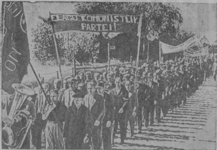
По всей Эстонии состоялись массовые митинги и демонстрации трудящихся, посвященные принятию Эстонской ССР Верховным Советом СССР в состав Советского Союза, в качестве равноправной Советской Республики. На снимке: трудящиеся Таллина направляются на митинг на площадь Свободы.