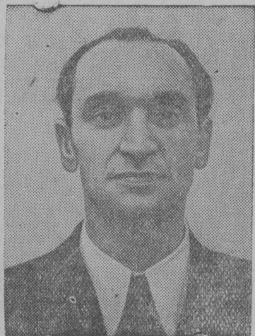
Исполняющий обязанности президента и премьер-министр Литовской Республики тов. Юстас Палецкис, выступавший на VII Сессии Верховного Совета СССР с заявлением Полномочной Комиссии Сейма Литовской Республики о вступлении Литовской ССР в состав СССР.