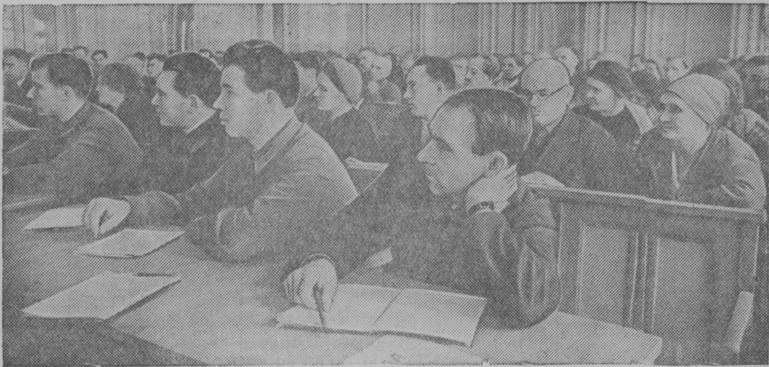
Горький городын осис воскреснӧй университет, кӧдаын велӧтчӧны предприятияэзись 1000 мымда рабочӧй да служащӧй. Снимок вылын: университетын велӧтчисез ВКП(б) история сьӧрти лекция вылын.

Лунись лунӧ велӧтчын, настойчивӧя овладевайтны марксистско-ленинскӧй теорияӧн, организуйтны пропагандистскӧй удж сӧдз, кызд требуйтӧ ВКП(б) ЦК-лӧн постановленнӧ—ответственнӧй задача быд комсомолецлӧн да комсомольскӧй руководителӧн.