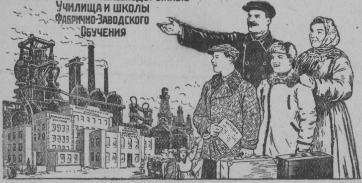
Рис. Лисевичли да Барковли.

Мы с радостью пошлем своих детей в Ремесленные и Железнодорожные Училища и школы Фабрично-Заводского Обучения