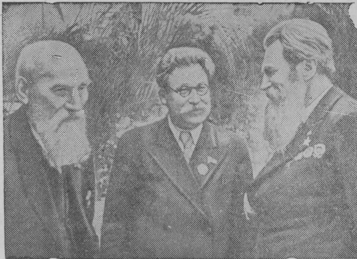
На снимке: Академики А. Н. Бах, Е. Ярославский и О. Ю. Шмидт.

В доме ученых (Москва) состоялось торжественное общее собрание Академии наук СССР, посвященное развитию Марксистско-Ленинской теории в работах И. В. Сталина.