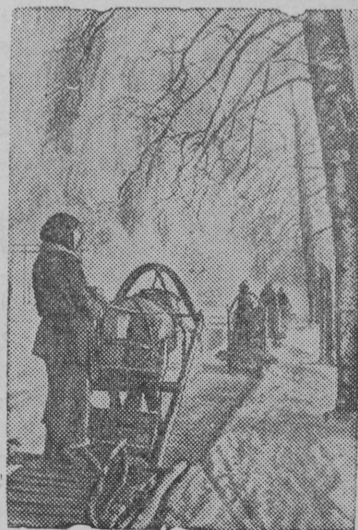
Трудящиеся Ярославской области своими силами и средствами строят дорогу Ярославль—Рыбинск.