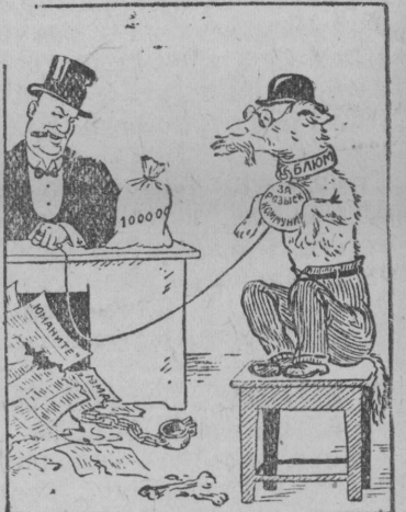
В ожидании очередного приказа. Рисунок Лисевича.