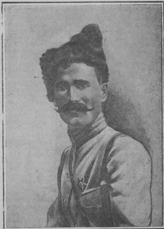
Василий Иванович Чалаев.