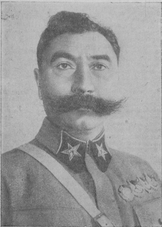
Семен Михайлович Буденный

(Ерт Сталин речись Московской Советлн торжественной пленум вылын, кбда вблб посвятитб Красной Армиялн X годовщиналб).