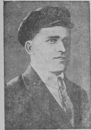
Снимок вылын: Ёрт С. М. Киров—XI армия революционной военной советлөн член. (1920 г.)