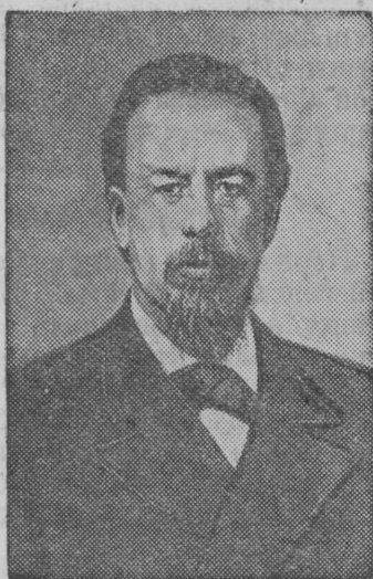
Александр Степанович Попов. (1859—1905)

Общӧй колхознӧй собраннӧ вылын колхозниккез петкӧтисӧ решеннӧ жизнерадостнӧй, том поколеннӧ быдтӧм понда пессӧм съӧртӧ корны социалистическӧй соревнованнӧ вылӧ Чапаевнима Родевскӧй колхозись колхозниккезӧс. Лопатин.