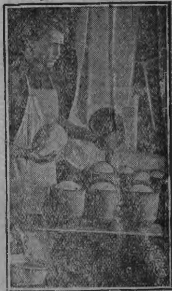
Заёмен вамен сельской хозяйством с товарной кароме