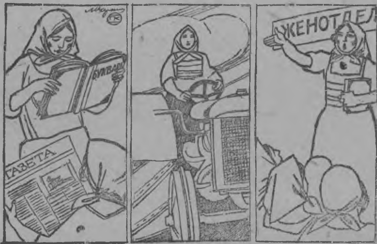
Ныл-кышнолы грамота оётыса пиёслась уз кыль.

Кытэтйез бад'ым уж луэ— ю удалтонлыкэз жутоно. Ю кидыс дасьтон но бад'ым уж