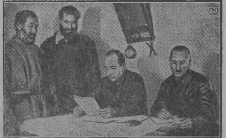
Москvaisь гуртэ потэм ужась бригада Оренбург округын Сергиев гуртын лишенец'ёслэсь курисконзэс учко.