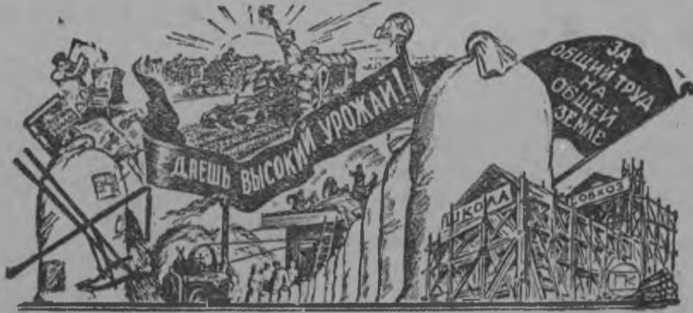
Коллективизаци, машинизаци вамен ю удалтонмес жутыса социализм кюрмес золомытом!