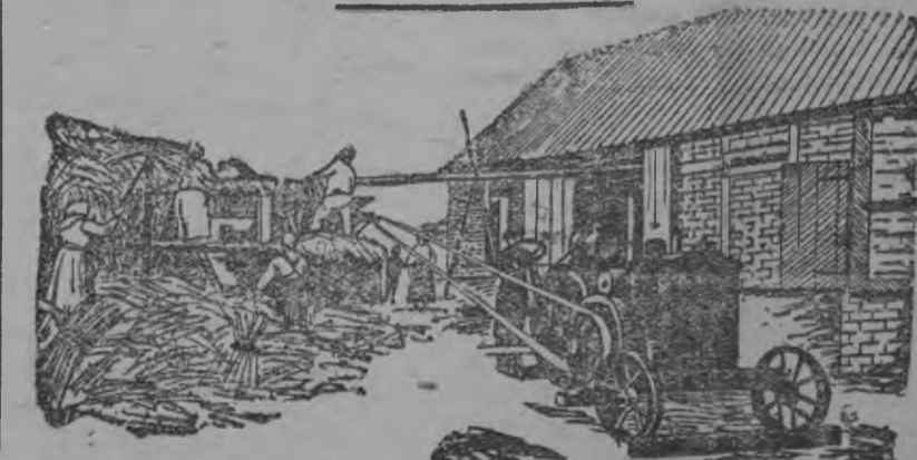
Кутэсэн губыр'яськыса кутсаёсконэз куштыса сталь кужимен-тракторен кутсаёско.

Куанер но-шоро-куспо ульс'ёс мылыгыса коллективне, артеле но товариществое пырыло. Соёс муз'ем ужан машинаёсты но минеральной кыдэз, юэз быдтыс во-мыр'ёсты но мукет'ёсэ тушмон'ёсты быдтонэз туж трос басытыло иин. Кресьян'ёслы, машинаёсты но мукет'ёсэ сётон уж ваньмыз с-х. коопераци вылын кылле. Та ужез азылань нуныны но виль жутыны понна кооперациёслы укседэс ватсаны кулэ на. Кытыс бен сое бастонэ? Основной укседэс татын паевой укседэс луэ. Талэс валлэ паевой укседэс котыкылэс одыг мында октылыськына. Улэмез вылэмез-я укседэс охтэмын ой вал. Али кресьян'ёс группан тавы люкылэммын: Батрак'ёс кооперативе членэ пырыны 5 манет тыро. Выт тырымтэссыз — куанер у л и с'ё с'ы з — 10 манет тыро. Шоро-куспо ульс'ёс — 25 манет, нош индивидуально выт тырысез — 40 манет тыров. Пай одыг кооперативе гинэ тыроно. Нош та паевой укседэс тырыса, кресьян'ёс аслаз районис'тызы ваньмыс'тыз сельско-хозяйственной кооператив'ёсыс, ма кулэ сое, басытыны быгатовы. Али ваньзэ паевой укседэс кема возытэк кооперативной кассае сөт'яно. Кресьян'ёслы ваньмызлы кооперативе пырыны сөвят уз поты. Батрак'ёслы, но начар'ёслы куинь ар чөжелы укседэс тырыны рассрочка сөтиске.