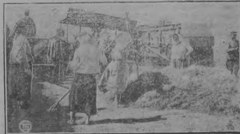
Украинаын выль вуэм юзэс вемеен кутсало.