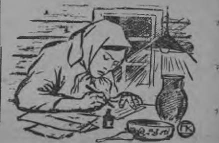
Чыл-кышноёс улэмды, вылэмды сарыс «Выль Гуртлэн» редакцияз ивортэ!