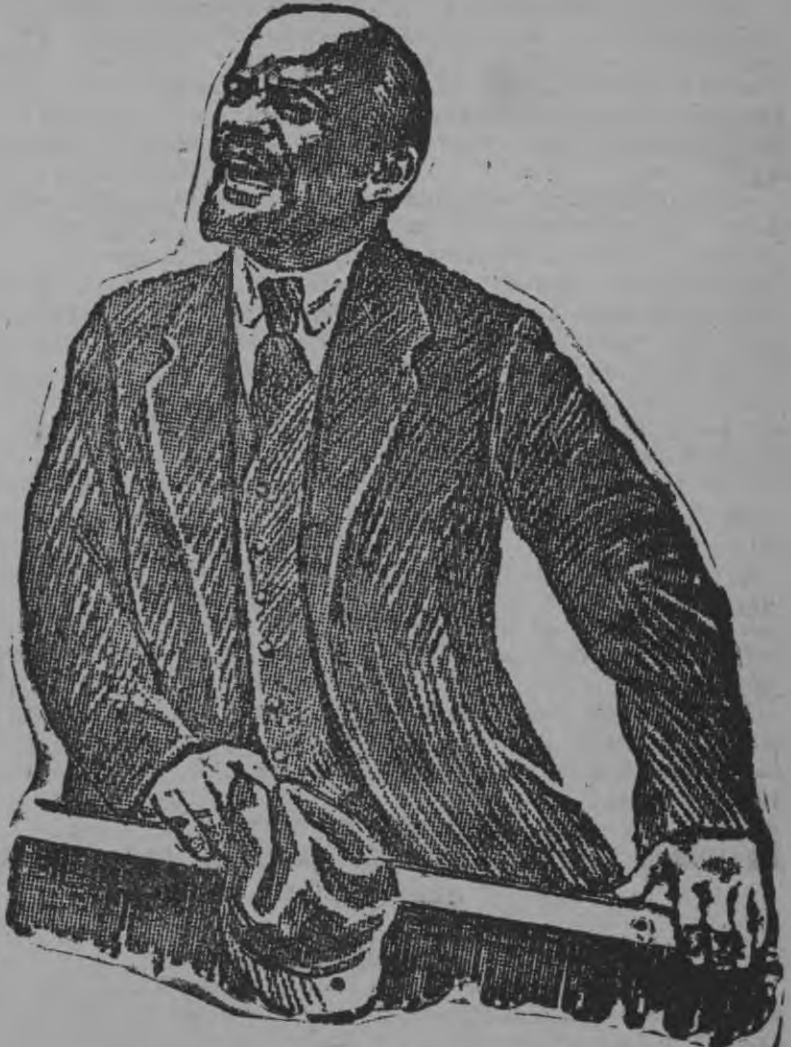
Дышетскелэ, дышетскелэ, дышетскелэ ты эш'ёс! Улыны дыше, ужаны дыше коммунайын ты эш'ёс!

Таёе верам кыл'ёссэ Ленин эшмылэсь эвёл вунэтоно.