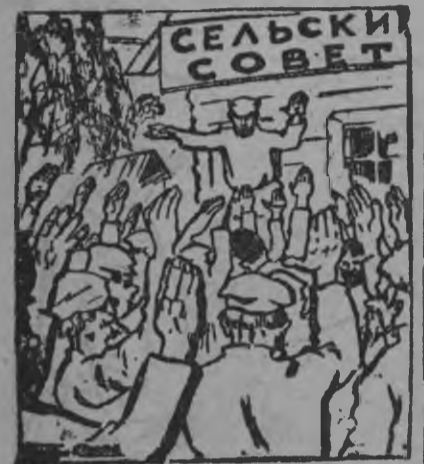
Быр'йсьёслэсь наказзэс, носемзэс өвёл вунэтно.

Дурнопи сельсоветлэн районаз 13 гуртыс, тямыс гуртын гинэ муз'ем люкемын вал. Мукет'ёсаз гурт'ёсын муз'емзы люкемын вал ке но бригадир'ёс классовой принципез өвёл утиллям. Мукет гурт'ёсын сивыл муз'ем люкон кампани орчтыон дыр'я одйг колхоз, куинь машинной товарищество кылдытмын. Куинь гурт трос лудэн ужаны гошкызы.