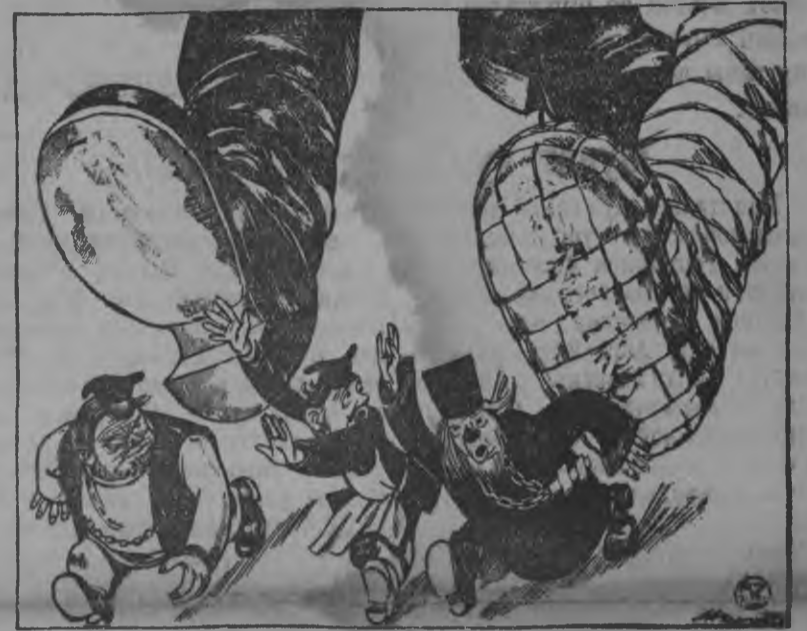
Совет'ёсты быр'ён уж вуиз. Токма гинэ бэрзэс учко, таёслы советэ скрес пытсамын. (Гуртмыжык, солэн быж'илаз ветлысь но пол нерге).

Мукет волосьёсын но таке уж'ёс шбдйсько. Чём дыр'я таке нбм пуктыло: «Кенешо власьлэн уж'ёсызлы пумит мынэмез понна кыл правазэ талано». Умойгес эскероно ке, со лишней'ёсы шоро-куспо ульсьёс дуо. Кенеш'ёсын куддыр'я само-