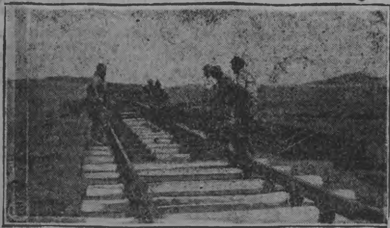
Шпал'ёс вилтй рельса тыро Туркестано-Сибирской чугун өюрес 185 километр куза лэстылэм ий. 10-тй январысен кутсына нуналлы быдэ 1 километр лэстылэтызы.