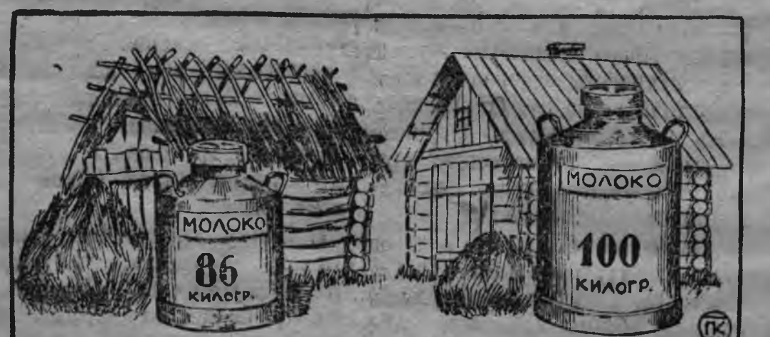
Суредын: паллян палаз кезыт гидын, бурпалаз шунит гидын вордыса мар луэмез возматамын.

Гид'ёсты тол азе шунит кароно. Кезыт гид—кресьян муртлы туж пайдатэм, из'ян гид. Шунит гидын сярись, кезыт гидын сыкал тросгес сие. Ном йблэз ичигес сётэ. Смоленской губернийыс Энгельгартовской опытной станцийын тазы эскеризы. Одйгакдэ сисьёсэ кык сыкал'ёсты дас нунал чоже 7 1/2 градус шунито гидын возизы. Собрере гидзэс 1 1/2 градус гинэ шунит карыса 10 нунал чоже возизы на. Собрере ношик со сыкал'ёсты ик 14 градус шунит гидэ пыртыса 10 нунал возизы. Озы эскерем беразы, умойгес лйд'яса, тазы луиз: кезыт гидын возыгузы кыкна сыкаллэн 14 процентлы йблэз синиз. Со но туж кизер луиз. Валля сярись йблэстыз вбес 11 процентлы улти луиз. Озы тини, кезыт гидын сыкалэв вордыса, кресьян муртлэн 100 килограм йблэс 14 килограм йблэз но 11 процент'вбйзэ кынтэ, кыз ут'бабьты.