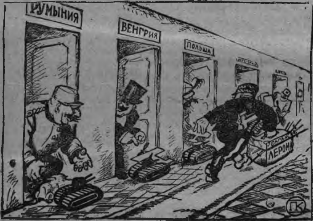
Парижыс сюлмасыс июнызы.