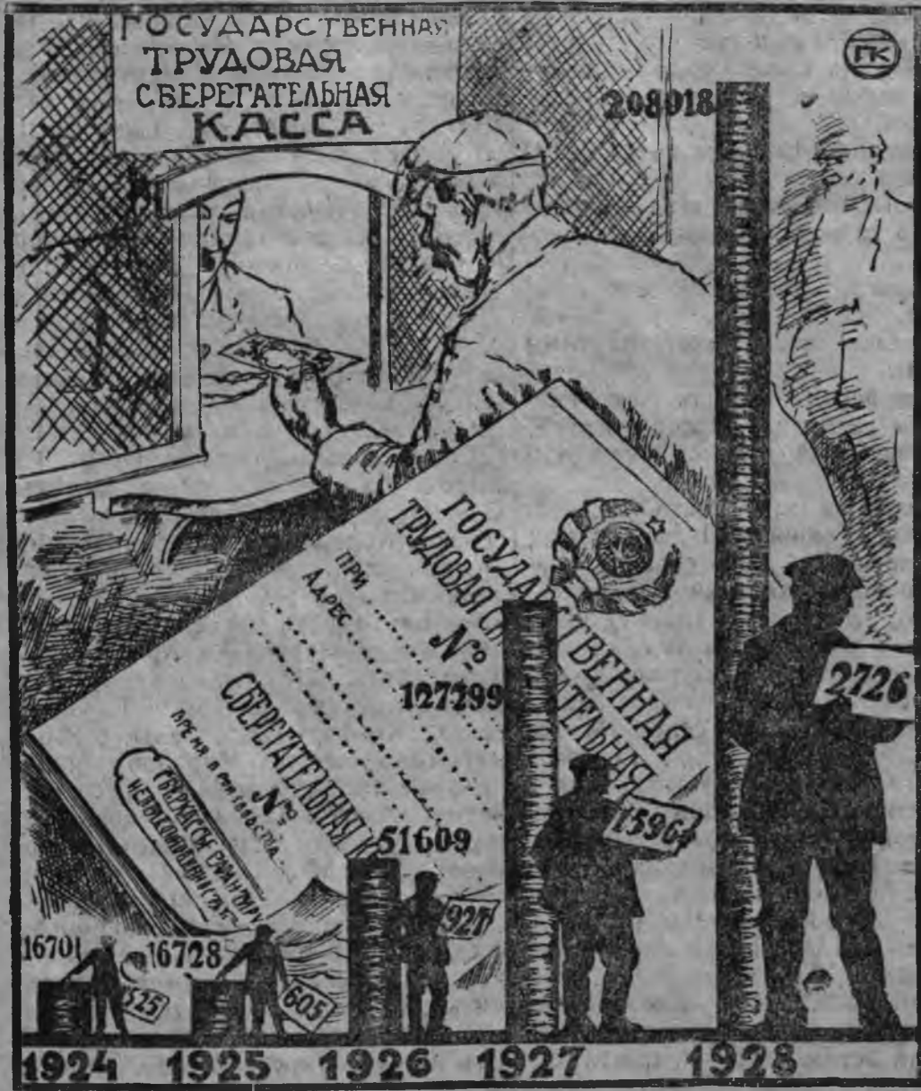
Коя шыр'ян кассалын арыс аре коньдон йлэмын сюрс манетэн ляд'яса юбөн-юбөн возматамын. Коя мурт коньдон шыр'ясёс люккасымь, сюрс муртэн-ик ляд'яса адиянин возматамын.