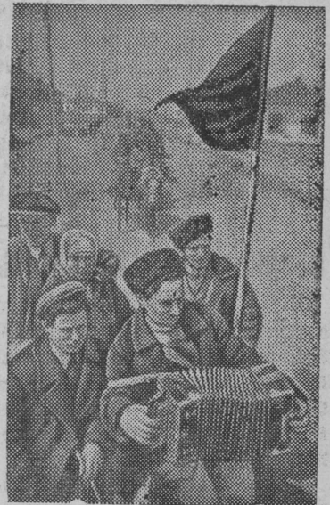
Колхозники Орджоникидзевского края едут на строительство канала.

25 апреля 1940 года началось скоростное строительство Невинномысского канала. Канал строится колхозниками Орджоникидзевского и Краснодарского краев, Ростовской области и Калмыцкй АССР.