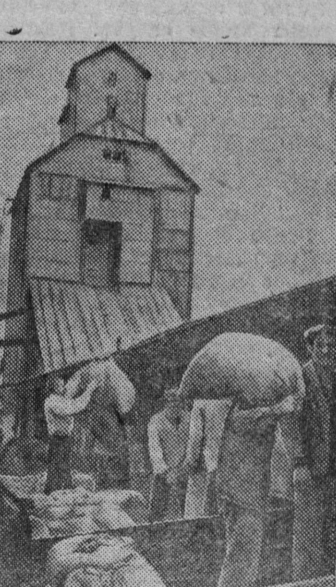
Сыпка проданного государству зерна на элеватор станции Ульяновка.

Бажинскй колхоз вузалас нянь 120 центнер, Ситковскй, Антипинскй, Кубеневскй да Соболевскй колхозээз выделитисб 100 центнербн.