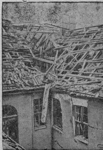
Жилой дом на Риттерштрассе, разрушенный в результате бомбардировки.

Бомбардировка Берлина Английской авиацией.